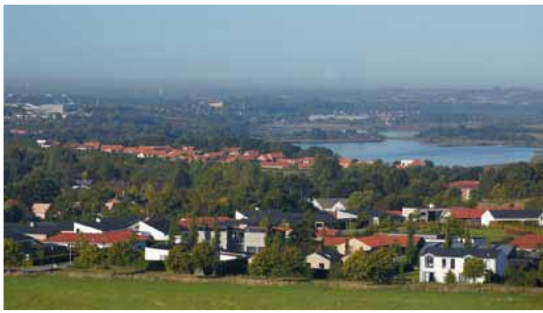
Bjergene. Fredet 2016, 300 hektar