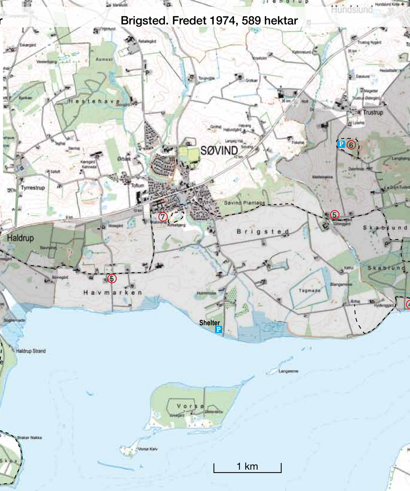
Brigsted. Fredet 1974, 589 hektar