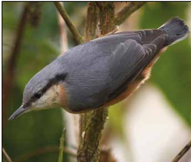
Spætmeise – en af de mange arter i reservatet.