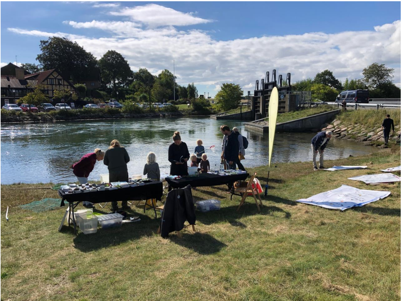
(Krible-krabledag i Norsminde september 2022)